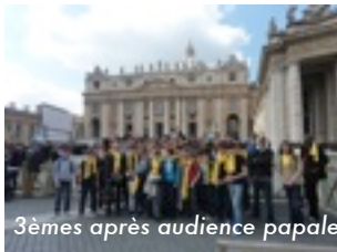
3èmes après audience papale

les élèves ont suivi un programme bien rempli. Ils ont visité basiliques et églises, vu le Colisée, le Forum Romain et étudié la catéchèse à travers l'art sacré. Le tout rythmé par des célébrations, des temps de réflexion et une journée au Vatican pour une audience Papale. Un projet dont le financement a été pour partie réalisé grâce aux initiatives portées par les collégiens et leurs parents et par les subventions allouées par l'APEL de St Joseph et l'UDAPEL. Et un voyage qui n'aurait pu avoir lieu sans leurs accompagnateurs, dont le Père Félicien et les mères d'élèves : merci de leur avoir consacré ces quelques jours dont le souvenir restera certainement parmi les plus « forts » de leur scolarité à Saint-Joseph !